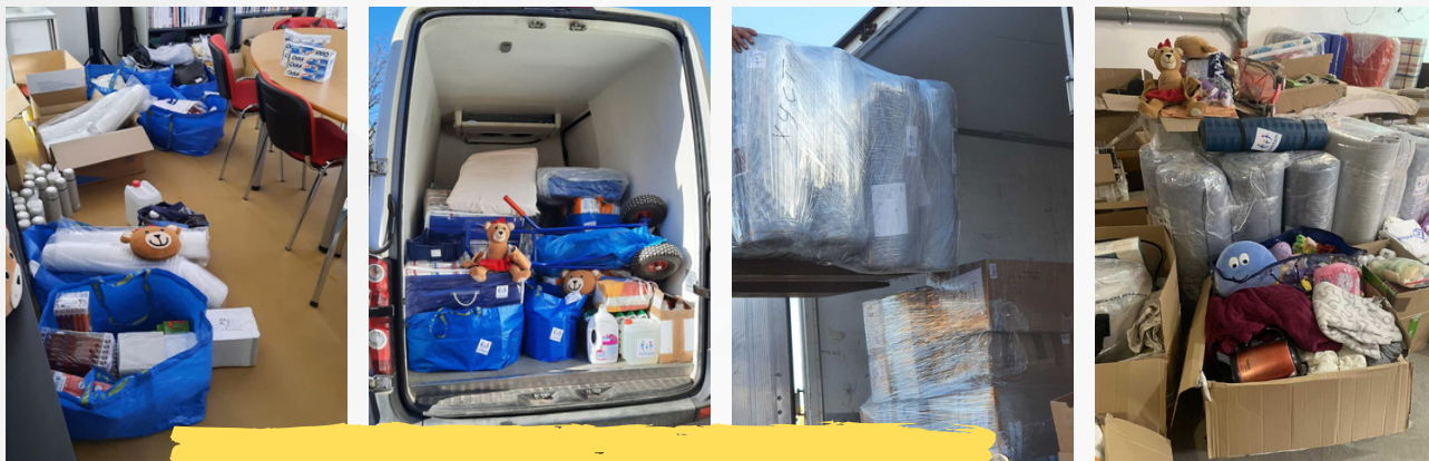
Cesta materiální sbírky do ukrajinského Chustu

Uspořádali jsme proto finanční a materiální sbírku mezi zaměstnanci na všech našich pracovištích a také mezi našimi příznivci. Sbírkou potřebných věcí jsme zaplnili celé dodávky. Za vybrané finanční prostředky jsme zakoupili matrace, deky, lůžkoviny, hygienické prostředky, jídlo a mnoho dalšího.